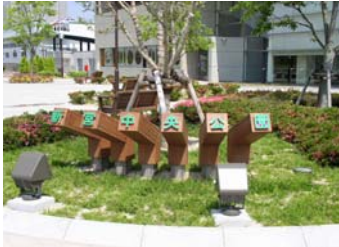
■ エントランスには木材の街らしい演出も・・・

★魅力：温もりのある木材を施設の素材に生かすことにより、木材の街としての印象を高めています。また、中央広場の巨木のゲートと踊る噴水は昼夜問わず、来園者を迎えてくれます。