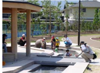
■ 園内の流れでは子どもたちの歓声！