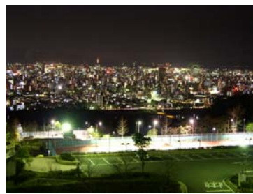
■市内の夜景も魅力的！