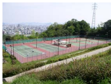
■市内を眼下に思いっきり汗かいて