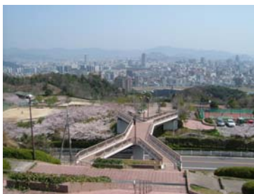
■最上段からの眺めは市内を一望

広島市内を一望できる最高のロケーション！ 気持ちいい風に吹かれながら、のんびりと過ごすのもよし、爽やかにスポーツもよし！