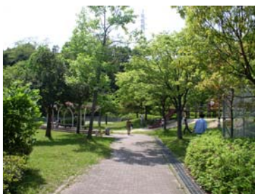
■木立の中のファミリー広場