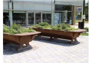
■ レイストベット型のプランター