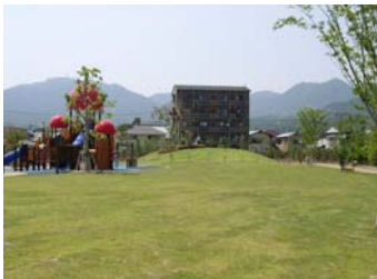
■ 広々とした芝生広場で駆け回って