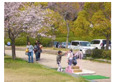
■花を楽しみながらのんびり散策