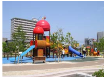
■ 子どもたちに大人気！複合遊具