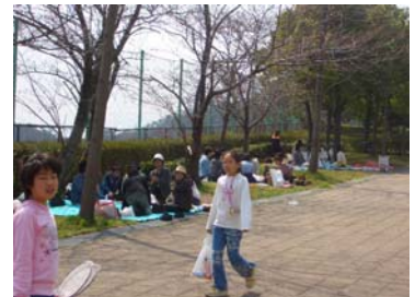
■みんなでお弁当食べて