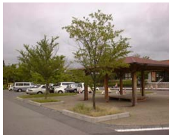
中国自動車道 安佐SA 駐車場の緑化だけでなく、休憩スペースも設置