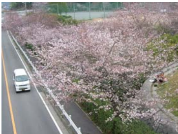
■公園の周りも桜でいっぱい

日時 8月26(土)・27(日) 10:00～16:00 詳細は竜王公園 HP をご覧ください。