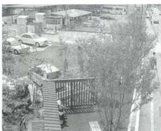
大阪府議会棟前駐車場