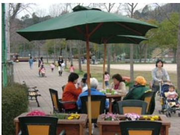
■オープンカフェとレイズドベット