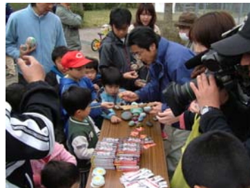
■子どもたちに大人気！宝探大会